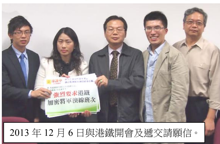
2013年12月6日與港鐵開會及遞交請願信。

港鐵指三班列車為一組，寶琳站現時的2.5分鐘5班車改為2.5分鐘4班車，康城站由10分鐘三班縮短至7分鐘三班，可提升繁忙時段的載客量，紓緩早上由油塘往鰂魚涌、港島綫，或觀塘綫的擠塞情況。